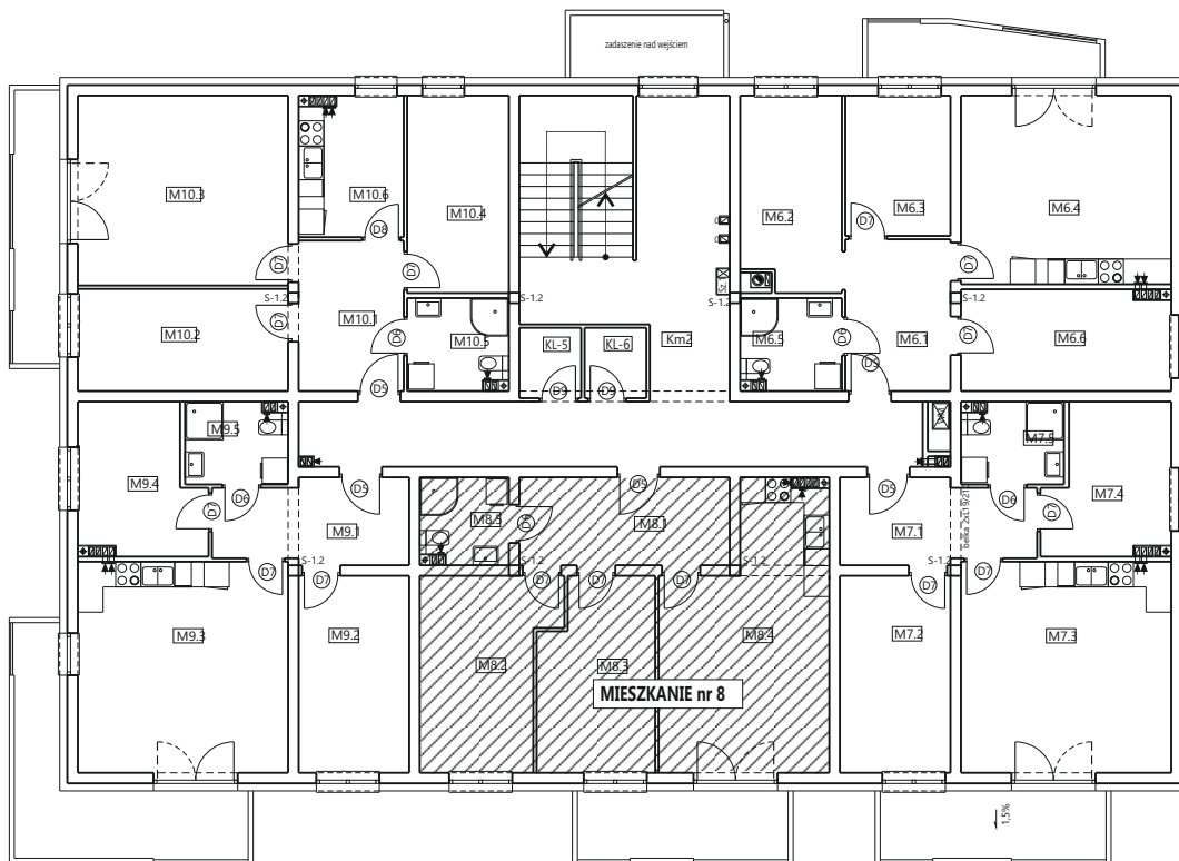
RZUT 1 PIĘTRA z zaznaczeniem lokalu mieszkalnego nr 8